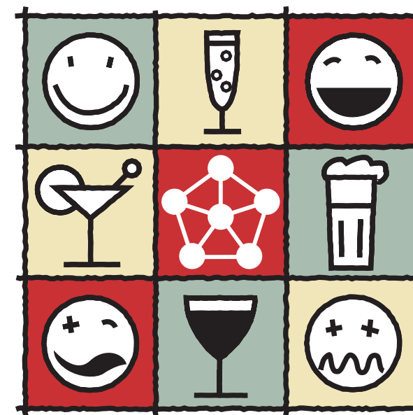
TABLE RONDE BRUXELLOISE

Les jeunes et l'alcool : vers une plate-forme ASBL Univers santé Place Galilée, 6 1348 Louvain-la-Neuve Tél : +32 (0)10/47 28 28 Fax : +32 (0)10/47 26 00 univers-sante@uclouvain.be